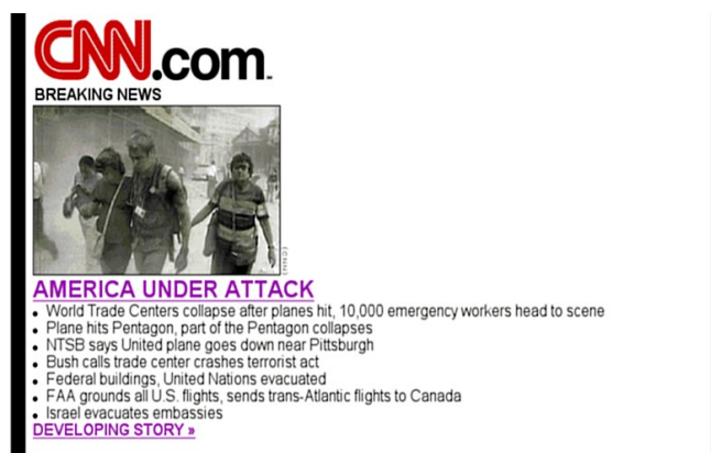
Figura 2 - Por causa de congestionamento, site da CNN vira site light em 11/09 Fonte: Digital Collection 21

Do ponto de vista histórico, essa potência da blogosfera é realizada, de forma intensa, pela primeira vez com a ocorrência dos ataques terroristas em 11 de setembro de 2001. 19 O primeiro acontecimento que mostrou inicialmente o poder da internet como fonte de informação. No dia do atentado, os portais de informação das agências de notícias internacionais não conseguiram ficar estáveis por conta do excesso de tráfego nos seus servidores. Na época, a audiência do MSNBC multiplicou por 10. A da Fox News, idem. Os usuários que ficavam nesses sites em torno de 3 segundos, ficaram no dia, entre 20 a 40 segundos. Não adiantou muita coisa usar o celular, as redes de telefonia também seguiram a mesma tendência: congestionamento. 20 O site da CNN teve que se transformar em um site light, reduzido a uma foto e a poucos links para tentar ficar no ar. O site mais acessado do mundo, o Google, alertava o usuário que não adiantava procurar notícias frescas sobre o assunto: “se você procura por notícias, você encontrará notícias mais atuais na Tv e na rádio. Muitos serviços de notícias online não estão disponíveis, por causa da extremamente alta demanda”.