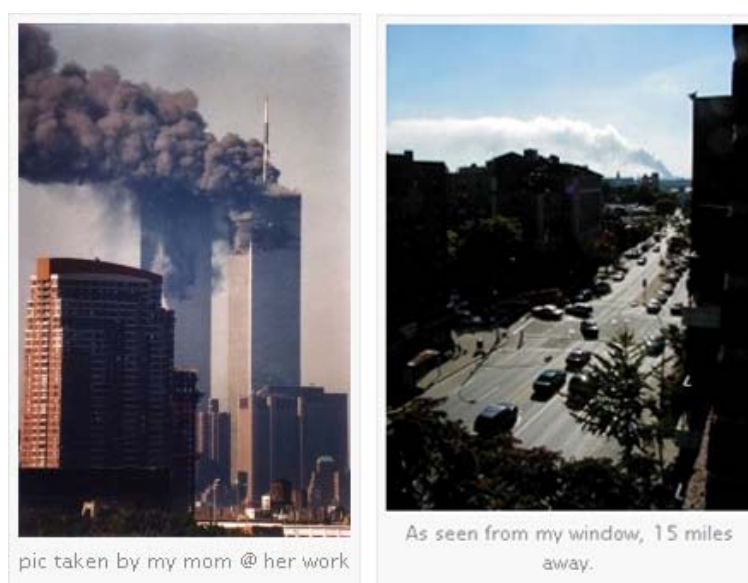
Fig. 5.4. Fotos do blog “_the vast clean cynikal abyss_” 10 . Tradução: (esqu.) foto tirada por minha mãe no trabalho; (dir.) como vejo da minha janela a 15 milhas de distância.

A narrativa desenvolvida por Lee Kottner busca narrar a experiência pessoal durante o evento. As pessoas começam a dizer o que estavam fazendo quando o acidente aconteceu, como foi saber, o quanto ficaram chocadas. Em alguns casos, a pessoa reportava o que viu, chegando bem próximo do que veio a ser conhecido como jornalismo cidadão. Diante das repetidas imagens que passavam nos canais de TV, moradores de Nova York começam a publicar fotos (fig. 5.4) e escrever histórias sobre o que vêem e o que vivem. Ao mesmo tempo, um contingente de pessoas busca informações na Web atrás de novos ângulos, novas opiniões: talvez mesmo em busca de alguém que dissesse que aquilo tudo era mentira.